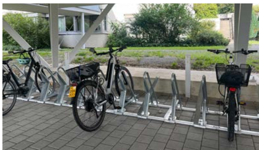
Veloparkierungsanlage für Mitarbeitende mit direktem Zugang zu den Garderoben beim Spital Wil