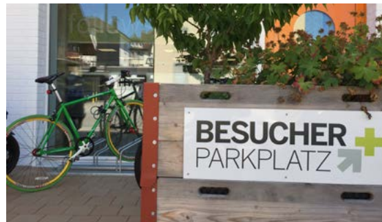
Eingangsnahе Veloabstellplätze und Besucherparkplätze bei W & P AG in Wil