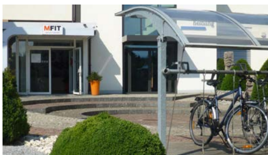
Gedekte Veloabstellanlage am Eingang bei MFIT in Wil